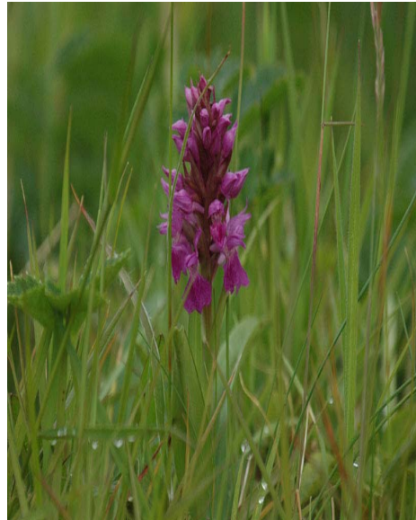
Faroe Nature/Janus Hansen

Í Føroyum eru friðingarnevndir og yvirfriðingarnevnd. Í yvirfriðingarnevndini sita landsforfrøðingurin og leiðarin á Náttúrugripasavninum. Møguleiki er at velja fleiri fakfólk í nevndina. Formaður nevndarinnar er sorinskrivarin. Hesar nevndir taka egnar avgerðir við støði í lögtingslóg nr. 48 frá 9. juli 1970 um náttúrufriðing, sum seinast er broytt við lögtingslóg nr. 110 frá 29. juni 1995. Friðingar eru gjørdar sambært friðingarlógini av t.d. Mølheyggjunum á Sandi, men her er nærur eingin upplýsing og eingin handheving av hesi friðing, og tí kunnu partar av varðveitingarvirðinum missast, um ikki skjótt verður borið at við sjónligari og munadyggari verju. Tey ymisku búøkini á friðaðum sum ófriðaðum økjum eru hvørki kortløgð ella skeltað, og eingin allýsing er gjørd fyri, hvussu hesi skulu kortleggjast og skeltast.