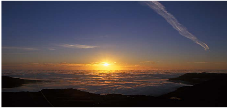
Faroe Nature/ Janus Hansen

Støðan í dag er, at Føroyar formliga eru bundnar av alskyns skyldum, sum eru ásettar í